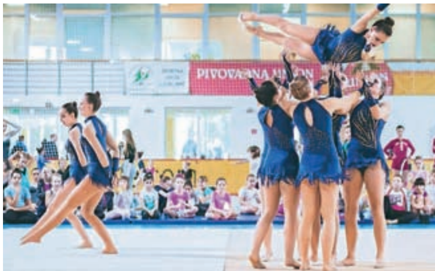
Na reviji ritmične gimnastike

Ritmična gimnastika združuje prvine baleta, modernega plesa, akrobatike in