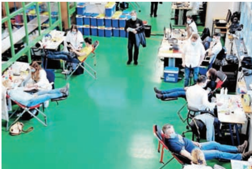
Na Rdečem križu v Cerkljah so zadovoljni z odzivom krvodajalcev.

V organizaciji kranjskega območnega združenja Rdečega križa Slovenije, Komisije za krvodajalstvo ter prostovoljk in prostovoljcev KORK Cerklje, je bila v torek, 2. marca, v Športni dvorani v Cerkljah prva letošnja tradicionalna terenska krvodajalska akcija, ki se je udeležilo 119 krvodajalcev. Prostovoljci KORK Cerklje so se ponovno izkazali z odlično organizacijo in izvedbo ter pokazali vse svoje znanje ob takšnih organizacijsko zahtevnih terenskih akcijah, še posebej v času epidemije. Območno združenje Rdečega križa Slovenije (RKS) Kranj je v letošnjem letu uspešno organiziralo že pet krvodajalskih akcij, in sicer dve v Kranju, po eno pa v Preddvoru, Šenčurju in Cerkljah, ki se jih je udeležilo 875 krvodajalcev. Naslednja krvodajalska akcija v občini Cerklje bo 30. septembra na isti lokaciji. Krvodajalci so se morali v času epidemioloških ukrepov držati vseh predpisanih varnostnih navodil. Krvodajalce