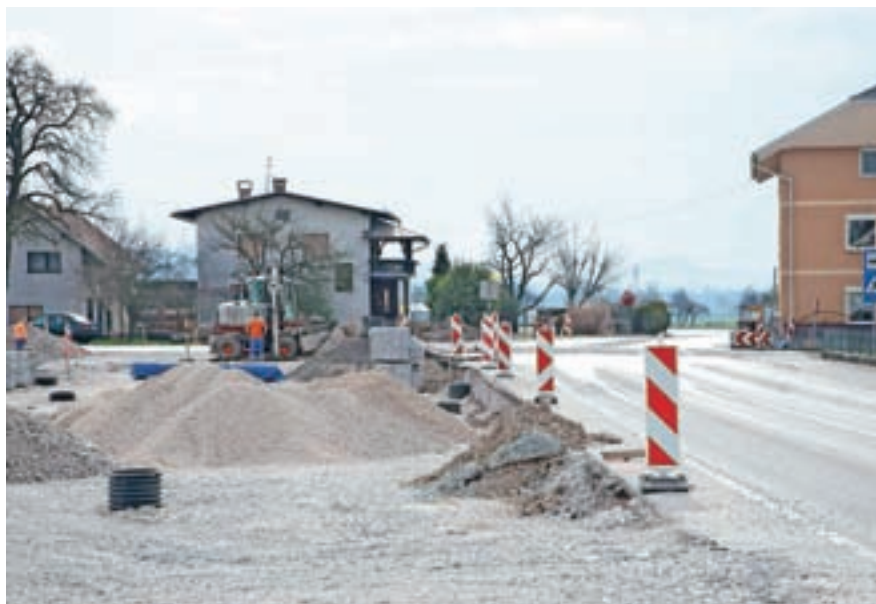
Gradnja krožišča na Trati

Skupaj z izgradnjo krvavškega vodovoda na tem delu občine na Trati v teh dneh potekajo tudi dela za preureditev križišča med cestami Češnjekovelesovo in Praprotna Polica–Adergas. Na tem delu, ki velja za enega najnevarnejših odsekov v celotni občini, bo odslej krožišče. S tem bodo v