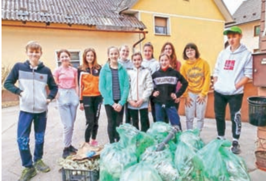
Učenci, ki so se lotili čistilne akcije