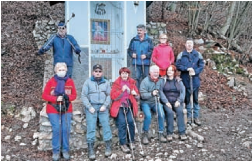
Skupina pohodnikov 23. Mačkovega pohoda na poti na Šenturško goro