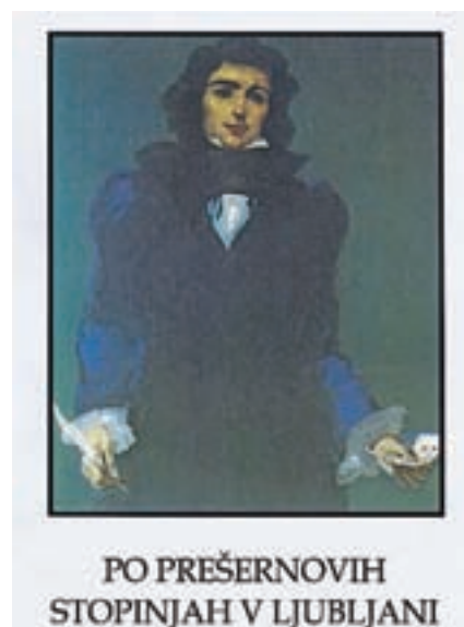
Naslovnica publikacije, ki so jo izdali člani društva