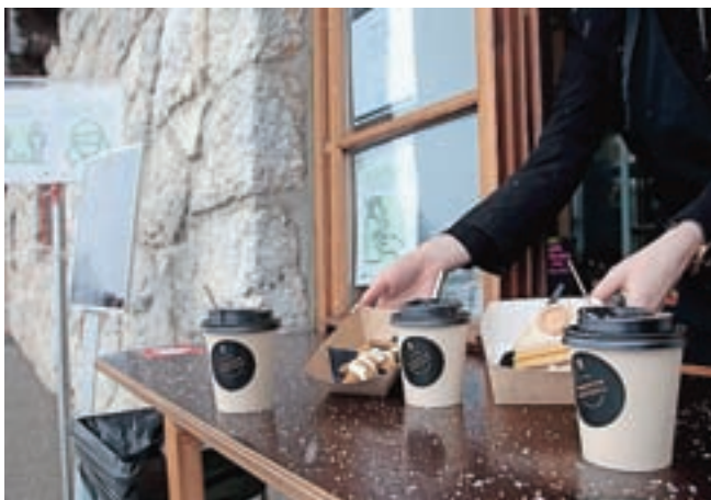
Besede »gremo na kavo« izpodriva »kava za s seboj.«