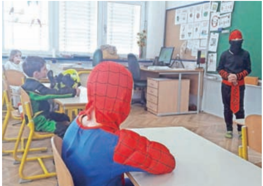
Pustovanje v zaloški šoli

Pustovanju se v času epidemije nismo odpovali. Učenci so se našemili v