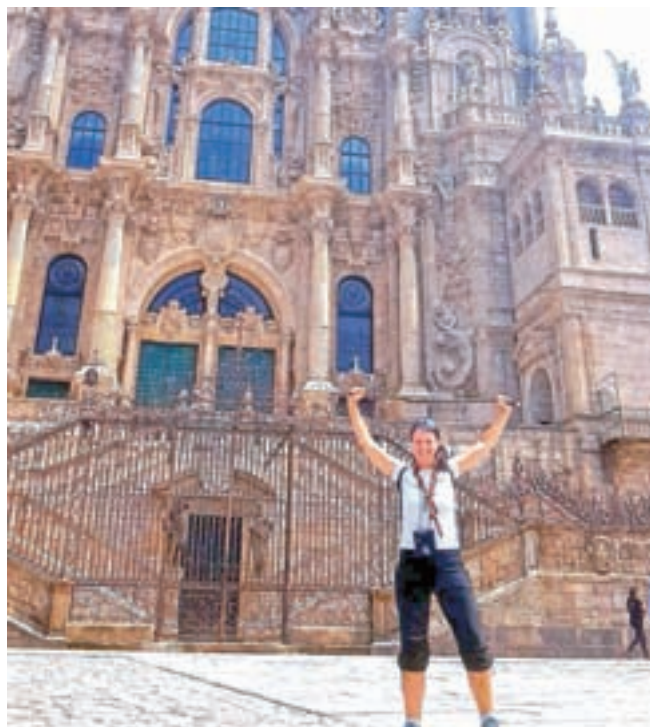
Ob prihodu v Santiago de Compostela

cilj pa je skozi knjigo nagovoriti bralce s stotimi predlogi za moralno življenje.« Pravi, da je na cilj dospela bolj ponižna, vztrajna, odločna, pozitivna, notranje svobodna, blagoslovljena, notranje mirna in bolj usmerjena v prihodnost.