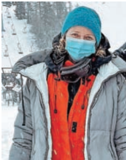
Naomi Watts

Kakšno podrobnost o filmarjih na Krvavcu so zapisali tudi v sporočilu za javnost pri RTC Krvavec. Seveda med prvimi, da je Naomi Watts z ekipo uspešno zaključila del snemanja filma Neskončno neurje. Smo pa kasneje izvedeli še, da se je snemalni dan začel v zgodnjih jutranjih urah in zaključeval precej pozno popoldne. Od RTC Krvavec je filmska ekipa že-