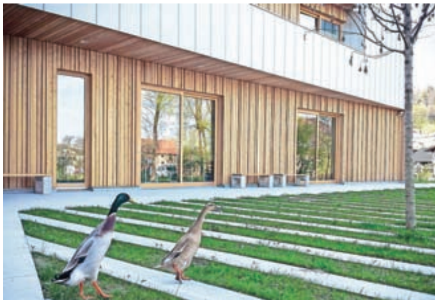
Varstveno-delovni center INCE Mengeš

Ne glede na to, da je TEM Čatež industrijski objekt, Materinski dom pa ima socialno funkcijo, je bil arhitekturni začetek v obeh primerih precej podoben. Najprej vedno opravimo valorizacijo okolja ter analizo in na osnovi tega izluščimo želje in ideje. V procesu snovanja objekta in vključevanja naročnika pa gredo stvari nato svojo pot. Materinski dom ima zaradi svoje močne zgodbe kot institucija in