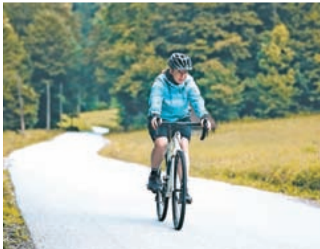
Gorenjska kolesarska pot obsega 640 kilometrov.

Gorenjsko kolesarsko omrežje poteka tudi po občini Cerklje na Gorenjskem po trasi G7 Prebačevo–Cerklje na Gorenjskem–Kamnik. Kolesarska pot poteka od Prebačevega skozi Šenčur do občine Cerklje, v kateri trasa poteka mimo Velesovega do Adergasa in Češnjevka. Nato pot pelje mimo gradu Strmol do TIC-a v Cerkljah. Iz Cerkelj pa naprej skozi naselja Pšata, Poženik, Šmartno, Glinje in Zalog pri Cerkljah v smeri proti Kamniku, kjer je zaključna točka omenjene trase.