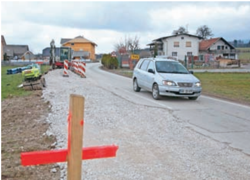
Gradnja krvavškega vodovoda je v polnem teku.